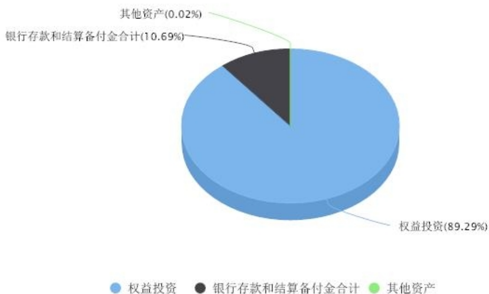
投资组合资产配置图表 数据截止日期:2025年09月30日