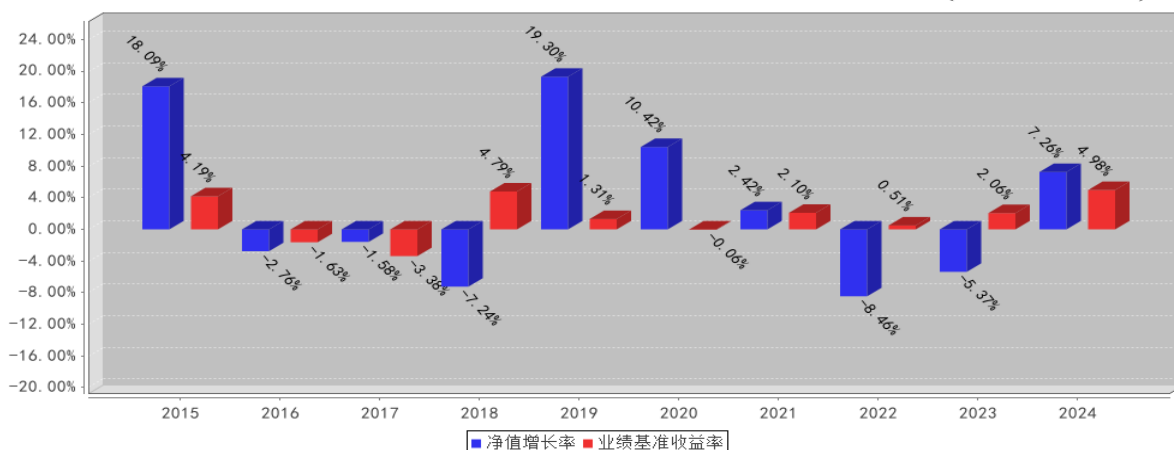
民生加银增强收益债券A基金每年净值增长率与同期业绩比较基准收益率的对比图 (2024年12月31日)

注：1. 基金合同生效当年/基金份额增设当年的相关数据按实际存续期计算，不按整个自然年度进行折算。 2. 基金过往业绩不代表未来表现。